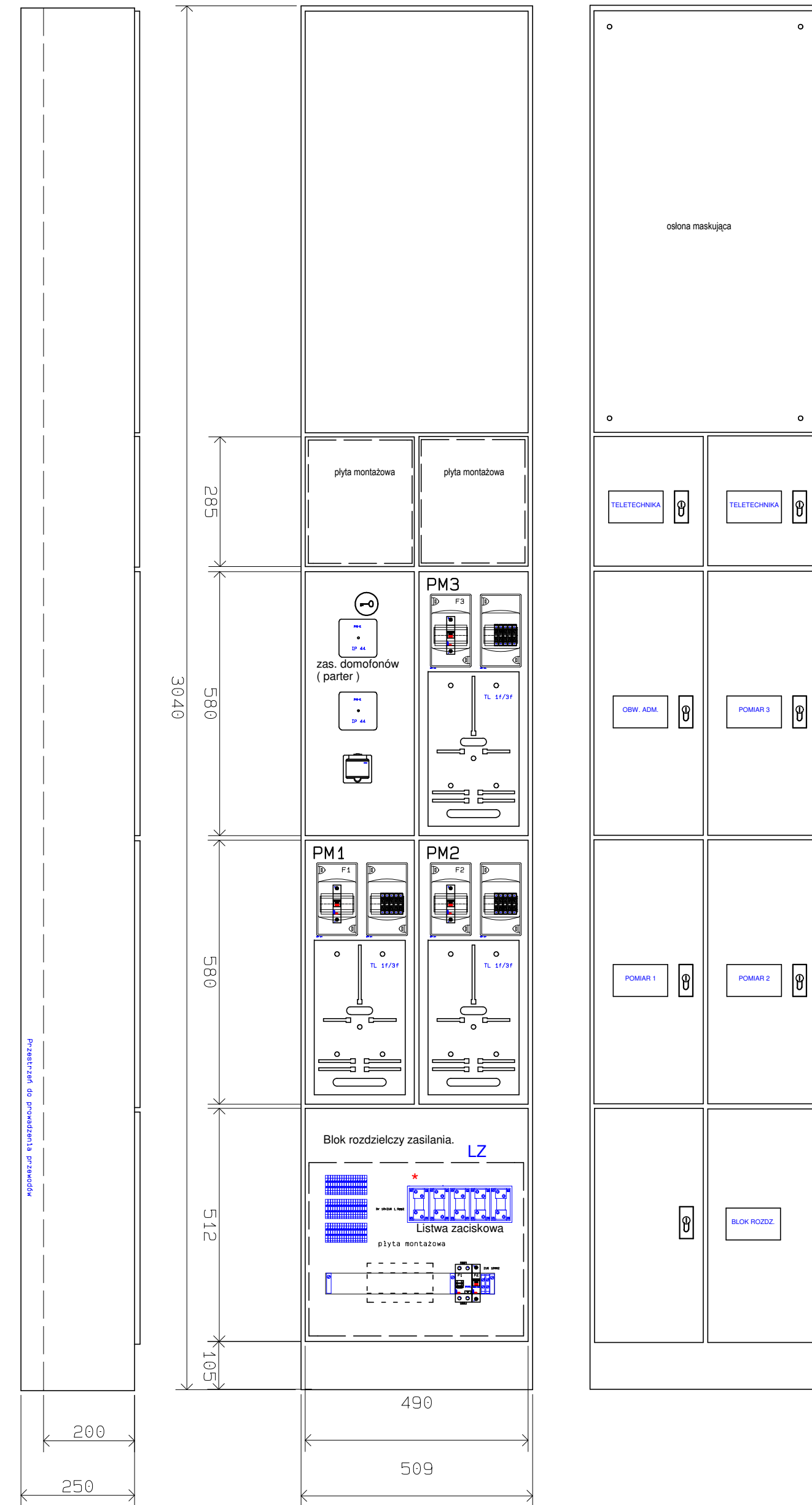
WIDOK MONTAŻOWY SZACHTU PIONOWEGO ZELP KL.3