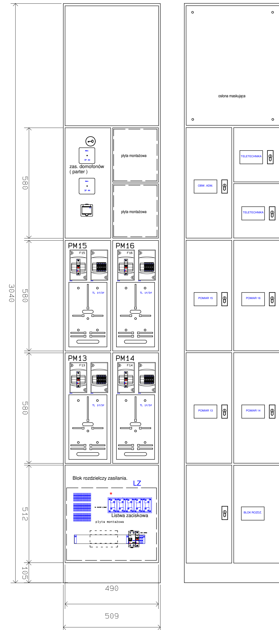
WIDOK MONTAŻOWY ZESTAWU TABLIC POMIAROWYCH ZELP KLATEK NR 1 i NR 2 ( ndla kl. nr 2 parter i I piętro)